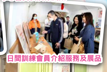
日間訓練會員介紹服務及展品