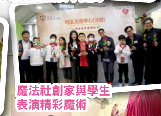
魔法社創家與學生表演精彩魔術