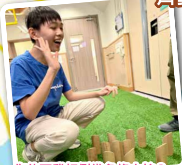
你估下我打倒幾多條木柱？ 同大家比賽，好緊張啊！