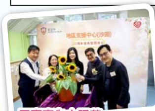
一眾嘉賓為太陽花注入五同力量！

在慶典暨共融演出中，我們一同在儀式內以寓意五同的水壺進行澆花，冀望我們日後的服務能同樣地注入「五同」的理念，包括： 同創 - 相信人具獨特性，以多元訓練啟發潛能； 同心 - 培育感恩常樂之心，建立身心靈健康； 同享 - 著重彼此分享，凝聚和諧的人際關係； 同伴 - 支援有需要家庭，陪伴走過逆境； 同活 - 建立可持續發展的環保與共融生活。一同開創更好的未來！