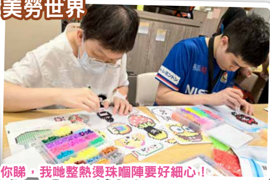
你睇，我哋整熱燙珠嗰陣要好細心！！