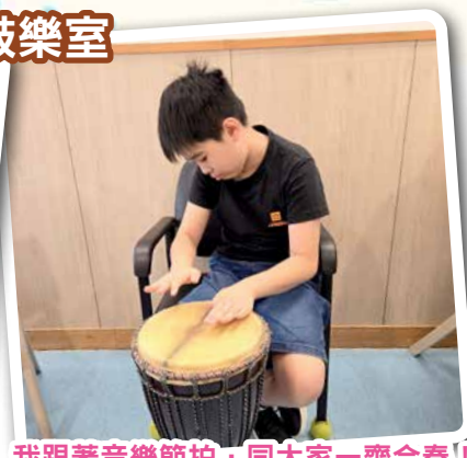
我跟著音樂節拍，同大家一齊合奏！