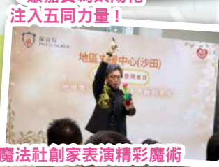
魔法社創家表演精彩魔術