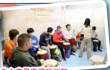
中心會員表演非洲鼓