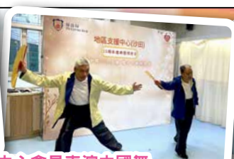
中心會員表演中國舞