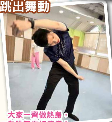
大家一齊做熱身， 為跳舞作好準備！