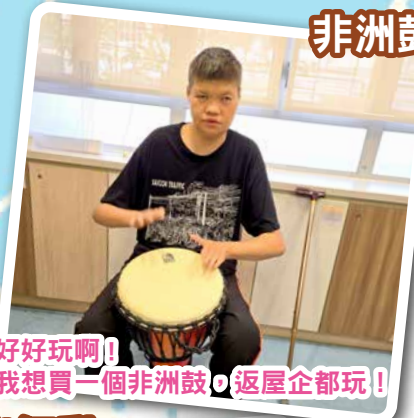
好好玩啊！ 我想買一個非洲鼓，返屋企都玩！