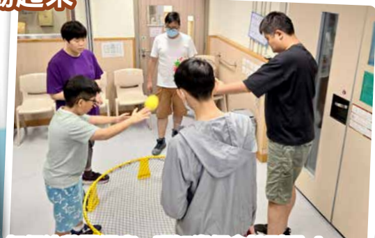
打個波落彈網度，唔知邊個會接到呢！！